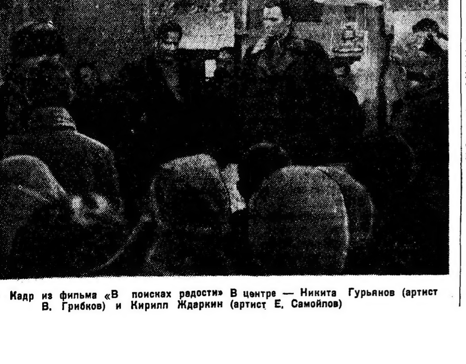
Кадр из фильма «В поисках радости». В центре — Никита Гурьянов (артист В. Грибов) и Кирилл Ждарикин (артист Е. Самойлов)